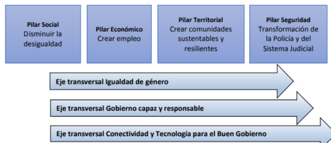
Figura 1. Pilares del Plan Estatal de Desarrollo, GEM, 2017